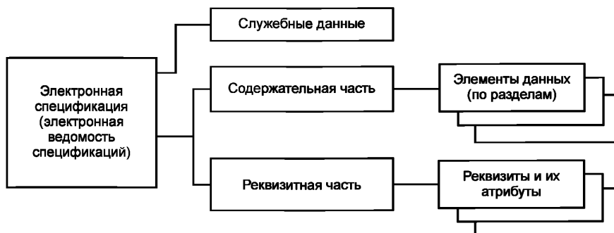
Рисунок 1 — Обобщенная структура ЭСП и ЭВС (верхнего уровня)

4.6 ЭСП (ЭВС), как правило, следует оформлять с применением ЭП (при наличии в АС средств, обеспечивающих проведение проверки подлинности ЭП). В этом случае порядок использования ЭП и источник сертификата ЭП устанавливают стандартом организации — разработчика ЭСП (ЭВС).