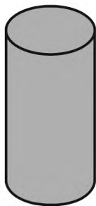
Рисунок 2 — Агломерированная корковая пробка

5.2 Агломерированные корковые пробки — это пробки, корпус которых целиком состоит из агломерата (рисунок 2). Пробки этого типа не следует использовать для игристых вин.