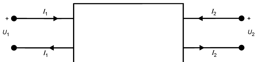
Рисунок 1 — Условные обозначения, используемые в электрических цепях

Для определения матричных элементов используются условные обозначения, показанные ниже на рисунке 1, соответствующие требованиям стандарта IEC 60375.