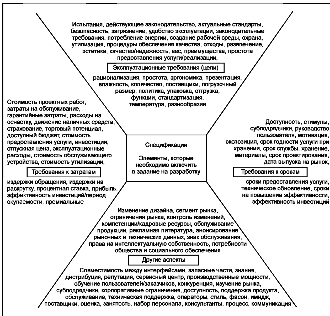
Рисунок 4 — Некоторые элементы характеристик и спецификации услуги