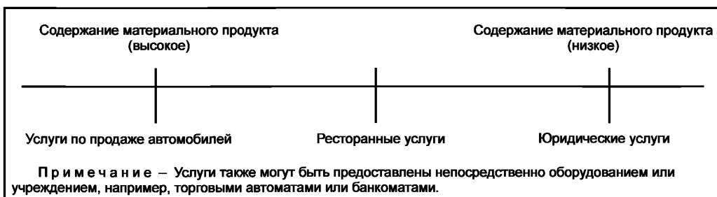
Рисунок 1 — Содержание продукта в спектре услуг

Рисунок 1 демонстрирует данную модель на примере трех типов услуг.