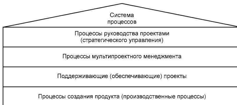
Рисунок 1 — Система процессов

Система процессов, представленная на рисунке 1, содержит основные группы процессов организации и их связи друг с другом. При этом различают четыре группы процессов, а именно, процессы руководства проектами, процессы мультипроектного менеджмента, поддерживающие (обеспечивающие) процессы и процессы создания продукта.