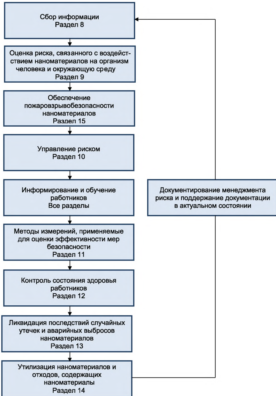
Рисунок 1 — Структура менеджмента риска, связанного с воздействием наноматериалов на организм человека и окружающую среду