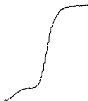
Рис. Полярографическая волна восстановления свинца в нейтральном аскорбиново-кислом растворе.