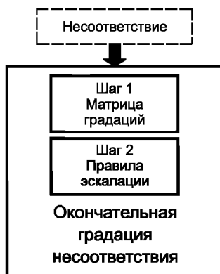
Рисунок 1 — Схема градаций

Шаг 2 — Применение дополнительных правил для определения окончательной градации.