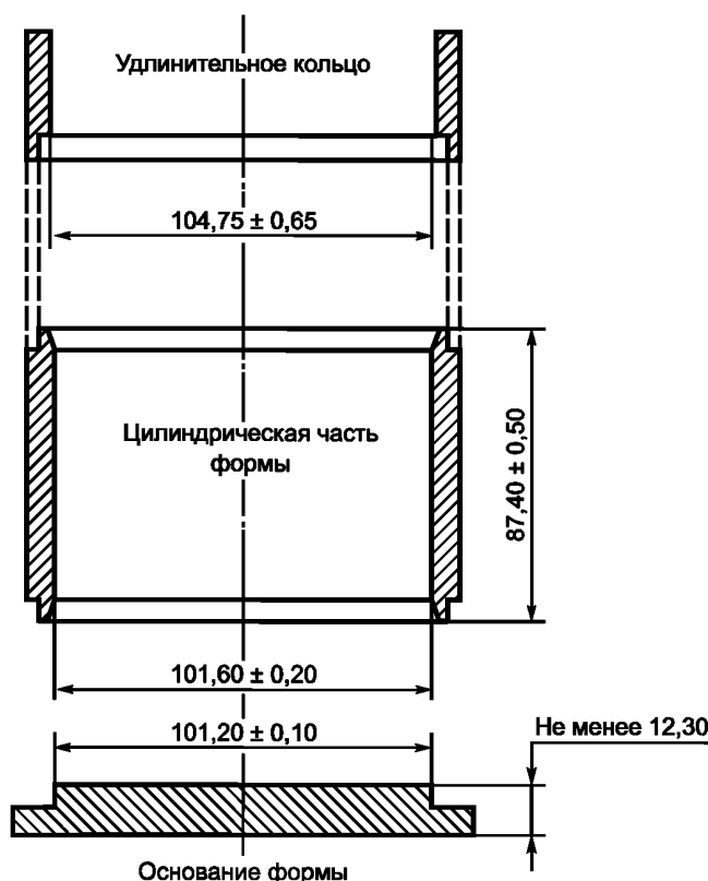
Рисунок 1 — Сборная форма для уплотнения образцов

3.1 Сборная форма для уплотнения асфальтобетонной смеси, состоящая из основания формы, цилиндрической части и удлинительного кольца в соответствии с рисунком 1.