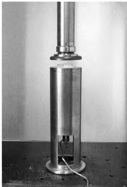
Рисунок 1 — Машина для испытания для определения механических характеристик при сжатии

5.3.2 Пример машины для испытания для определения механических характеристик при сжатии материала внутреннего слоя «сэндвич»-конструкций приведен на рисунке 1.