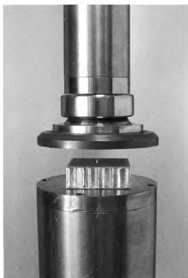
Рисунок 2 — Машина для испытания для определения механических характеристик при сжатии и устройство индикации смещения

П р и м е ч а н и е — Тензометры, жестко связанные с поверхностью исследуемого объекта, обычно считают непригодными для измерения деформации в данном случае из-за их жесткости. Армирующий эффект жесткой связи датчиков с некоторыми видами внутреннего слоя может привести к большим погрешностям в измерениях деформации.