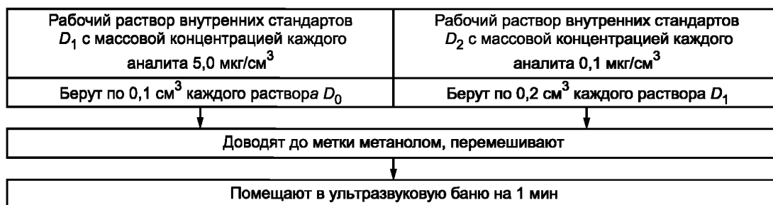
Рисунок 2 — Приготовление рабочих растворов внутренних стандартов D_1 , D_2

Рабочие растворы D_1 , D_2 готовят в мерных колбах вместимостью 10 см 3 согласно рисунку 2.