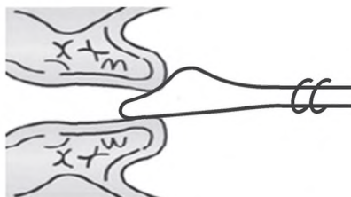
Рисунок 3 — Шпатель Эйра

Материал с влагалищной части шейки матки допустимо забирать с помощью шпателя Эйра (см. рисунок 3), а из цервикального канала — с помощью кюретки (см. рисунок 4).