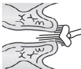
Рисунок 2 — Комбинированная щеточка, cervex-brush

Комбинированная щеточка используется для одновременного получения материала из цервикального канала и влагалищной части ШМ. При заборе материала следует сделать пять оборотов по часовой стрелке.