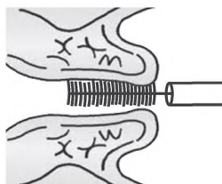
Рисунок 1 — Цитощетка или щеточка цервикальная

Материал с шейки матки забирают с помощью одноразовых щеток различного типа (см. рисунки 1—2). Для получения более информативного материала рекомендуется использовать два вида щеток cervex-brush и цитощетки различных типов.