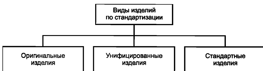
Рисунок А.5 — Виды изделий по стандартизации

А.5 Виды изделий по уровню стандартизации приведены на рисунке А.5.