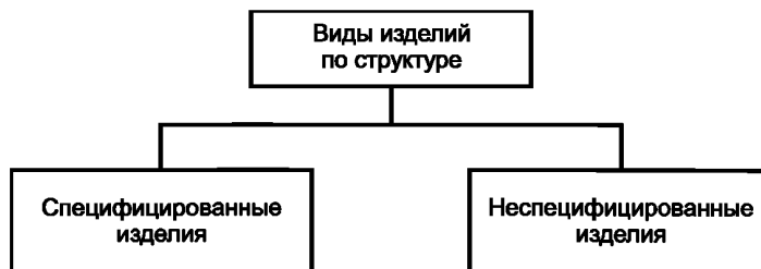
Рисунок А.4 — Виды изделий по структуре

А.4 Виды и структура изделий по структуре приведены на рисунке А.4.