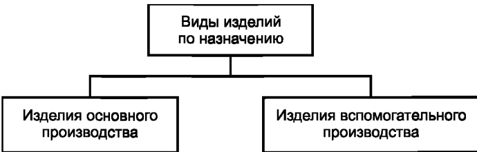
Рисунок А.2 — Виды изделий по назначению

А.2 Виды и структура изделий по назначению приведены на рисунке А.2.