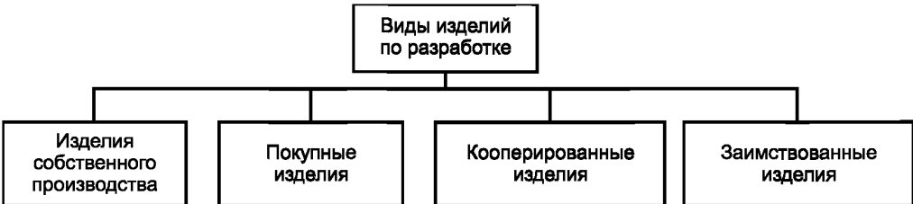
Рисунок А.3 — Виды изделий по разработке

А.3 Виды и структура изделий по разработке приведены на рисунке А.3.