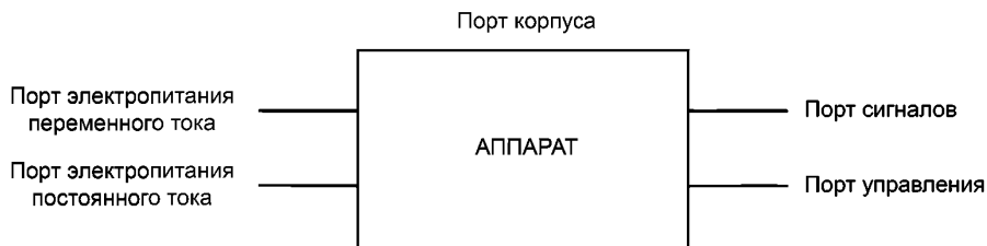
Рисунок 1 — Примеры портов

3.1.3 порт корпуса (enclosure port): Физическая граница аппарата, через которую могут излучаться или проникать электромагнитные поля.