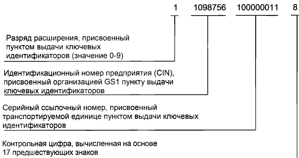
Рисунок А.1 — Строка GS1

Пример строки GS1 (18-значный серийный код транспортной упаковки — SSCC) для транспортируемых единиц приведен на рисунке А.1.