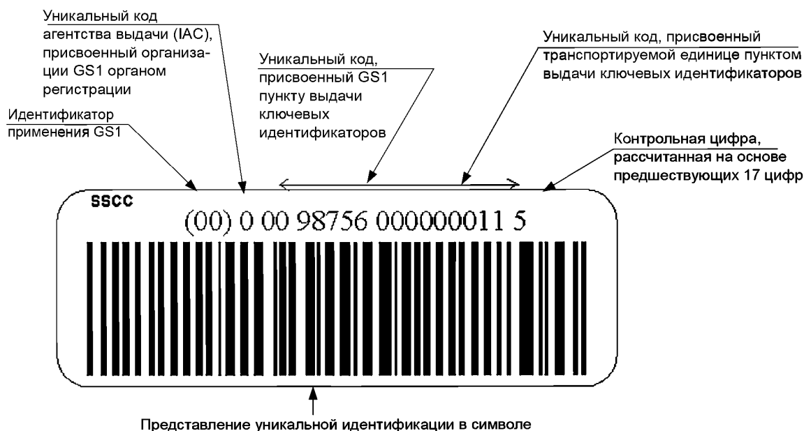
Рисунок В.1 — Представление ключевого идентификатора транспортируемых единиц в символе штрихового кода GS1-128

В соответствии с правилами международной организации GS1 строка в ключевом идентификаторе транспортируемых единиц состоит из 18 цифровых знаков, где первый знак (от 0 до 9) присваивает орган регистрации, следующие знаки организация GS1 присваивает пункту выдачи ключевых идентификаторов, а остальные — пункт выдачи ключевых идентификаторов. Последним знаком является контрольная цифра, рассчитанная на основе предшествующих 17 цифр (см. рисунок В.1).