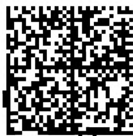
Рисунок А.3 — Тестовый символ для параметра «повреждение фиксированных шаблонов» (Fixed Pattern Damage) (символ Data Matrix)

На рисунке А.4 представлен символ QR Code с повреждением сегментов фиксированных шаблонов и шаблона информации о формате 3) , которые приведены в таблице А.3.