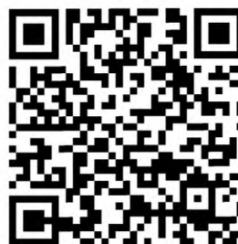
Рисунок А.4 — Символ QR Code с повреждением фиксированных шаблонов

На рисунке А.5 представлен символ Aztec Code с повреждением сегментов фиксированных шаблонов 1), 2) .