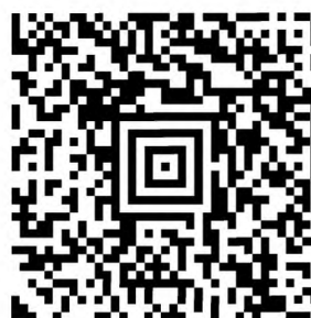
Рисунок А.5 — Символ Aztec code с повреждением фиксированных шаблонов