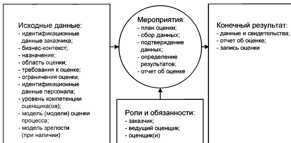
Рисунок 3 — Ключевые элементы процедуры оценки процесса

Обзор ключевых элементов процедуры оценки процесса приведен на рисунке 3. В ИСО/МЭК 33002 установлены требования, предъявляемые к проведению оценки; в ИСО/МЭК 33003 — требования, предъявляемые к системам измерения определенных характеристик качества процесса; в ИСО/МЭК 33020 приведена система измерения возможностей процесса; в ИСО/МЭК 33004 установлены требования к моделям процесса для поддержки процедуры оценки; в ИСО/МЭК 33010 приведены инструкции по проведению оценки и интерпретации требований, содержащихся в ИСО/МЭК 33002. Если возможно сравнение результатов оценки, то следует использовать ИСО/МЭК 33010 и систему измерения процесса. Семейство стандартов для оценки процесса обеспечивает общность подхода, применяемого во всех организациях.