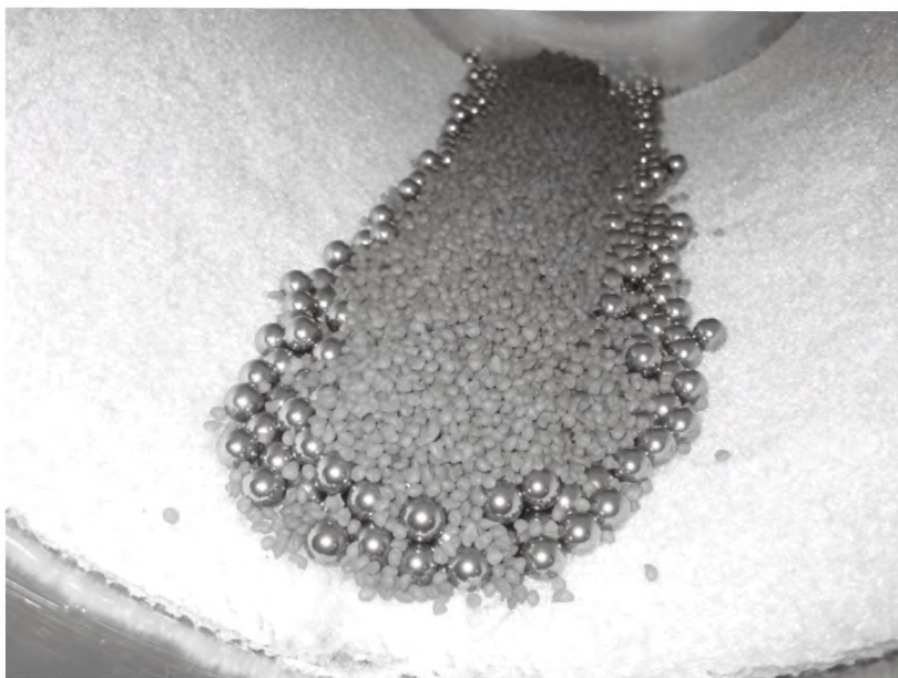
б) Загрязненные полимерные шарики в цилиндре