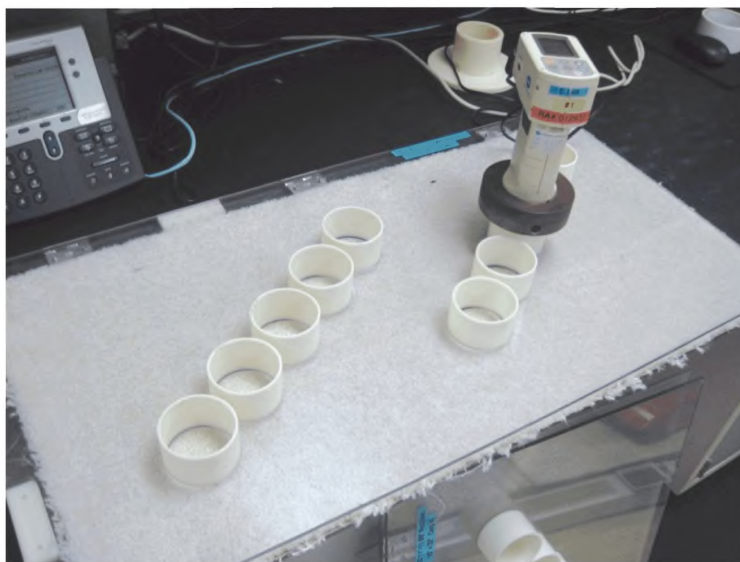
Рисунок 3 — Шаблон для измерения цвета ковра и колориметр

5.2.1.3.5 Незагрязненные образцы ковра искусственно пачкаются, используя метод испытаний ASTM D6540 для ускоренного загрязнения ворсовых ковровых покрытий. Образцы ковра помещаются в пачкающий цилиндр вместе с предопределенным количеством загрязненных шариков полимера и хромированных шариков легированной стали, и затем вращаются на предписанной скорости определенное количество минут в каждом из двух направлений, чтобы включить загрязнения в волокна ковра. (Типичный цилиндр для загрязнения ковра, подготовленный к ускоренному загрязнению, представлен на рисунке 4).