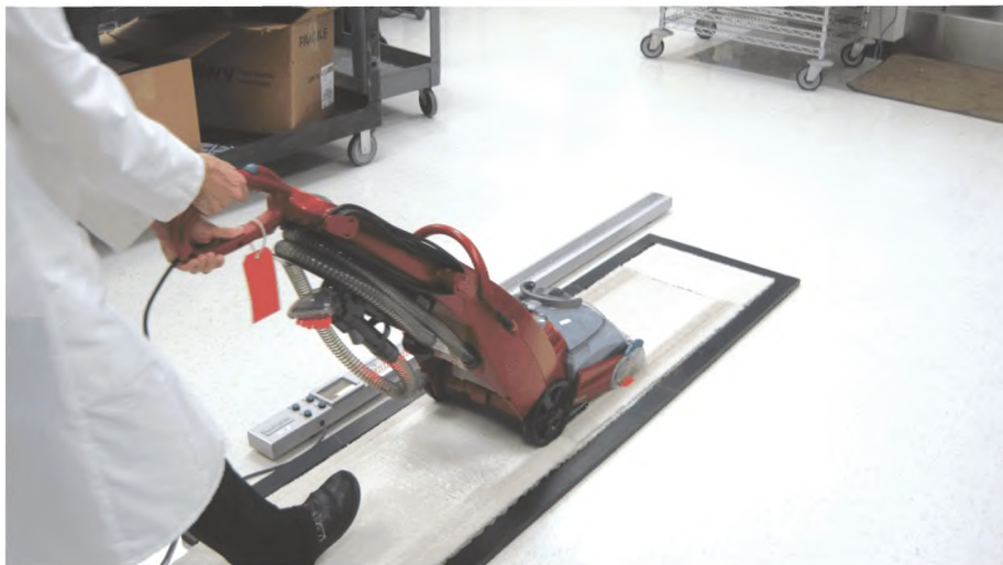
Рисунок 5 — Пример чистки ковра

один двойной ход, без распределения моющего раствора (сухо пылесосящие ходы). Этот цикл чистки выполняется на предписанной скорости хода, которой управляют. Очищенные ковры убираются в сторону и сохнут в течение по крайней мере 16 ч или до абсолютно сухого состояния. (См. пример рейки для высыхания ковра на рисунке 6).