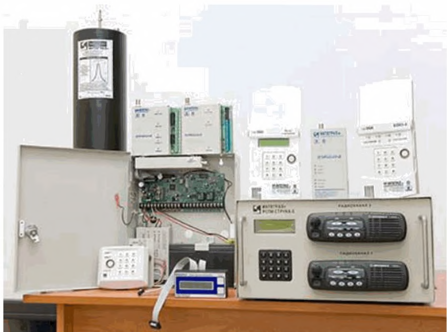
Внешний вид оборудования РСПИ «Струна-5»