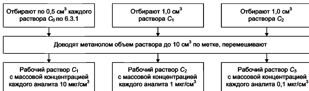
Рисунок 1 — Приготовление рабочих растворов C_1 , C_2 , C_3

Рабочие растворы C_1 , C_2 , C_3 готовят в мерных пробирках вместимостью 10 см 3 в соответствии с рисунком 1.