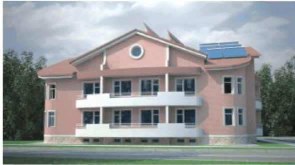
Рисунок 3 - Проект здания «12-ти квартирный энергоэффективный жилой дом» компании «ЭкоДолье».

В понятие энергоэффективного жилого дома закладывается комплекс конструктивных решений и дополнительных инженерных систем, в результате которых достигается реальное снижение затрат на эксплуатацию.