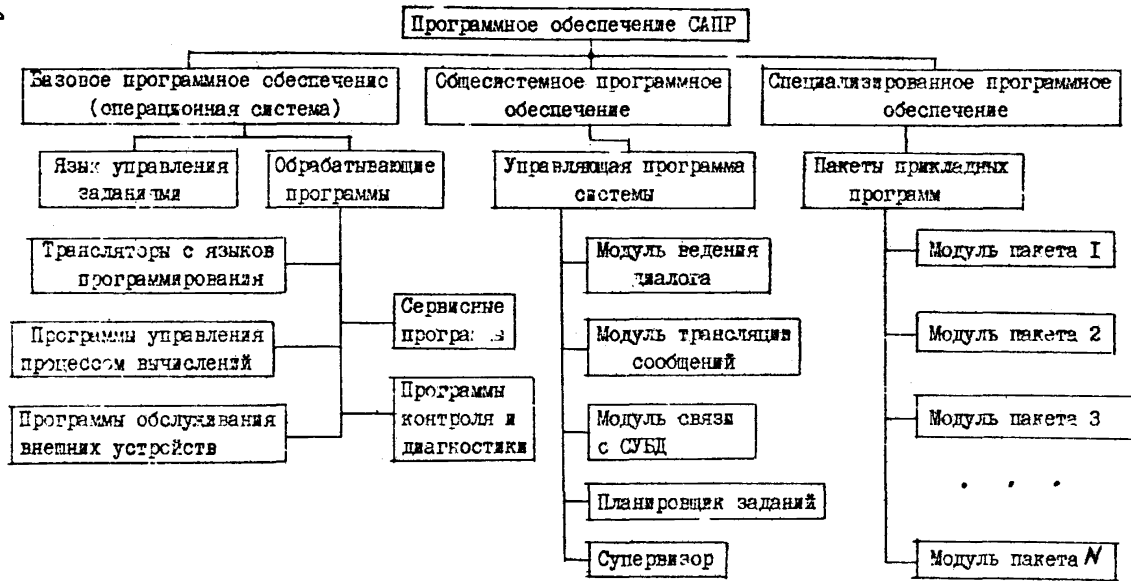
Рис.2.1. Структурная схема программного обеспечения САПР