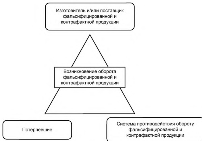
Рисунок 2 — Схема взаимоотношений участников противоправных действий, потерпевших от противоправных действий, системы противодействия обороту фальсифицированной и контрафактной продукции

4.2.4 Следует учитывать, что правонарушение, связанное с оборотом фальсифицированной и контрафактной продукции, происходит в тех случаях, когда обладающий мотивацией на совершение правонарушения изготовитель и/или поставщик фальсифицированной и контрафактной продукции и потерпевшая сторона (потребитель фальсифицированной и контрафактной продукции) одновременно присутствуют на рынке, и при этом система противодействия обороту фальсифицированной и контрафактной продукции не обладает необходимой эффективностью, чтобы предотвратить производство, поставку и передачу потребителю такой продукции.