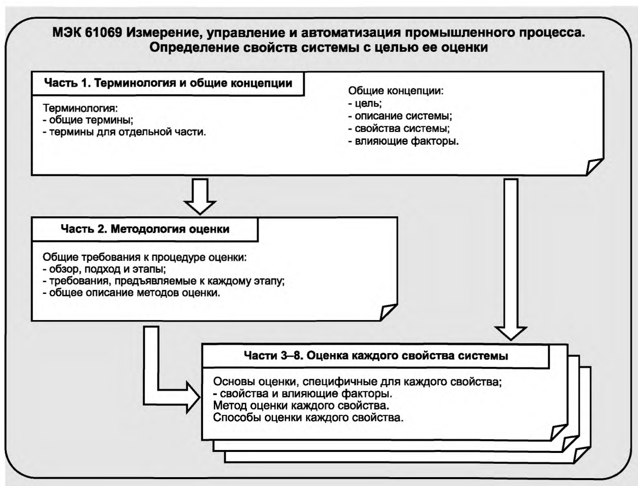
Рисунок 1 — Общий состав МЭК 61069

Некоторые примеры элементов оценки объединены в приложении С.