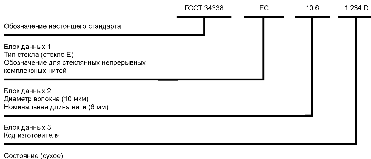
Рисунок 2 — Обозначение ГОСТ 34338-ЕС, 10 6, 1 234 D

2 Обозначение рубленых нитей с типом стекла Е, диаметром волокна 13 мкм, номинальной длиной нити 12 мм, применяемых для прессматериалов на основе реактопластов, приведено на рисунке 3.