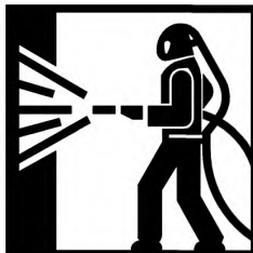
Рисунок 4 — Пиктограмма пескоструйных работ

Перчатки для пескоструйных работ маркируют в соответствии с требованиями EN 420. К перчаткам крепят пиктограмму пескоструйных работ (см. рисунок 4).