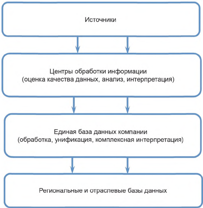
Рисунок 2 — Схема организации движения потоков геолого-технологической информации

6.1.1 На рисунке 3 представлена схема информационных потоков геолого-технологической информации нефтегазового предприятия.