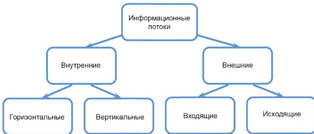
Рисунок 4 — Классификация информационных потоков

По отношению к информационной системе участника геолого-технической деятельности по добыче УВ выделяют внешние и внутренние информационные потоки в соответствии с рисунком 4.