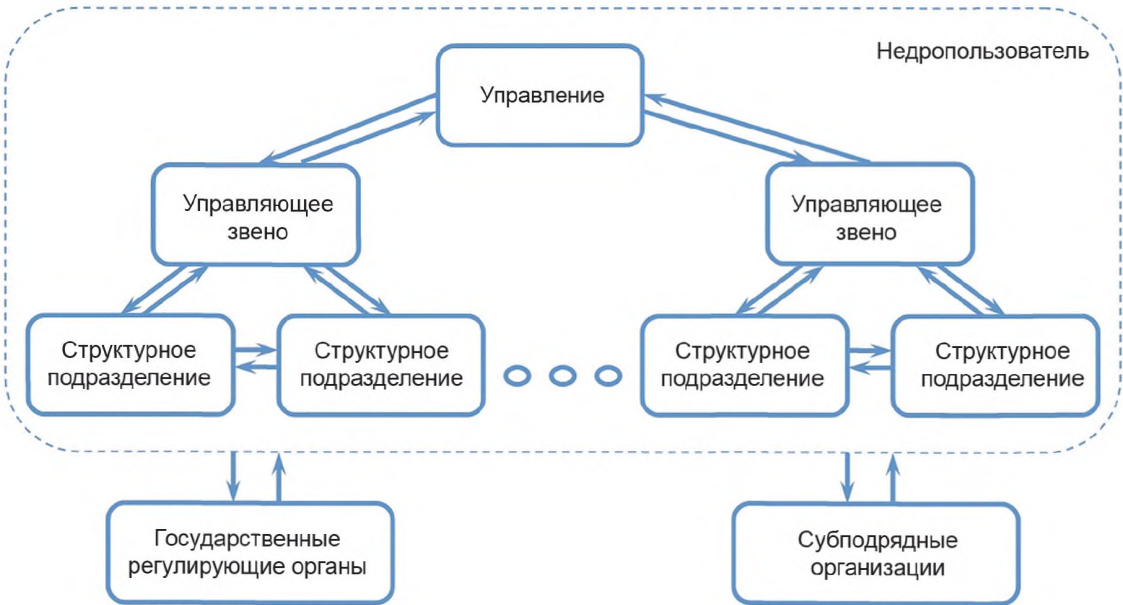
Рисунок 3 — Схема информационных потоков нефтегазового предприятия

6.1.1 На рисунке 3 представлена схема информационных потоков геолого-технологической информации нефтегазового предприятия.