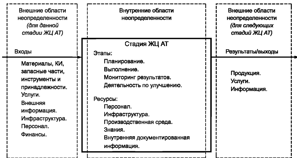
Рисунок 2 — Модель третьего уровня классификатора — области неопределенности стадии ЖЦ АТ

5.4 Третий уровень классификатора включает в себя категории в соответствии с моделью, приведенной на рисунке 2.