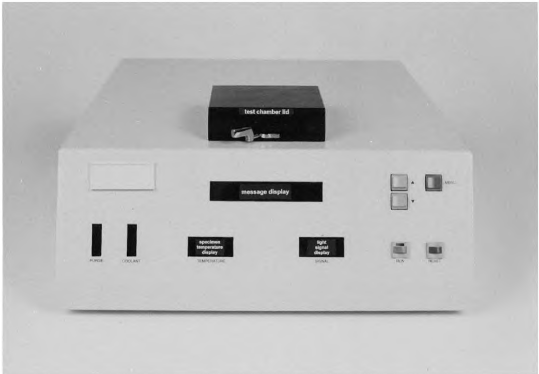
Рисунок А1.3 — Внешний интерфейс прибора