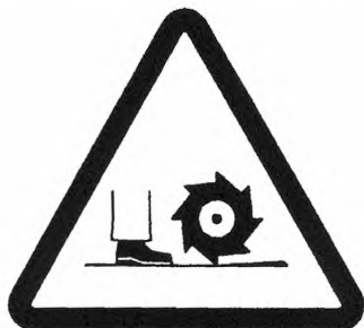
"ОСТОРОЖНО! ВРАЩАЕТСЯ ФРЕЗА" (Черный символ на желтом фоне)

На защитных ограждениях фрезерного рабочего органа с обеих сторон должен наноситься хорошо различимый и сохраняемый в течение срока службы предупреждающий знак "Осторожно! Вращается фреза". Оформление предупреждающего знака в соответствии с рисунком 2. Длина сторон треугольника не менее 60 мм.