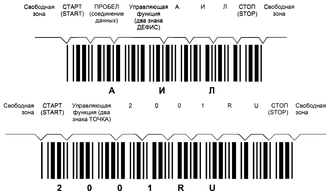
Рисунок ДА.2 — Символы штрихового кода, в которых закодированы данные АИЛ2001RU

Символы штрихового кода, в которых закодированы данные АИЛ2001RU, приведены на рисунке ДА.2.