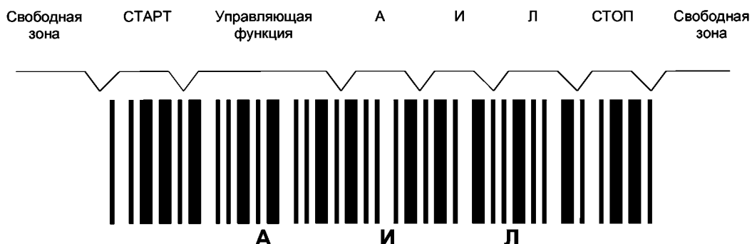
Рисунок ДА.1 — Символ штрихового кода, в котором закодированы знаки АИЛ

Служебные знаки «- -», «..» при декодировании не передаются и в визуальном представлении не указываются. Символы штрихового кода, в котором закодированы знаки АИЛ, приведены на рисунке ДА.1.