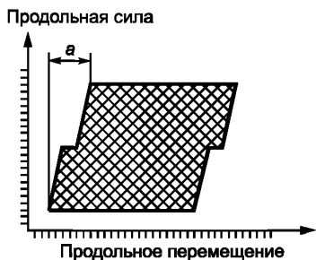
Рисунок 1 — Пример зависимости продольной силы от продольного перемещения

7.10.5 Строят зависимость продольной силы от продольного перемещения. Пример зависимости приведен на рисунке 1. Зависимость имеет два близких к горизонтальному участку, которые соответствуют работе сил трения.