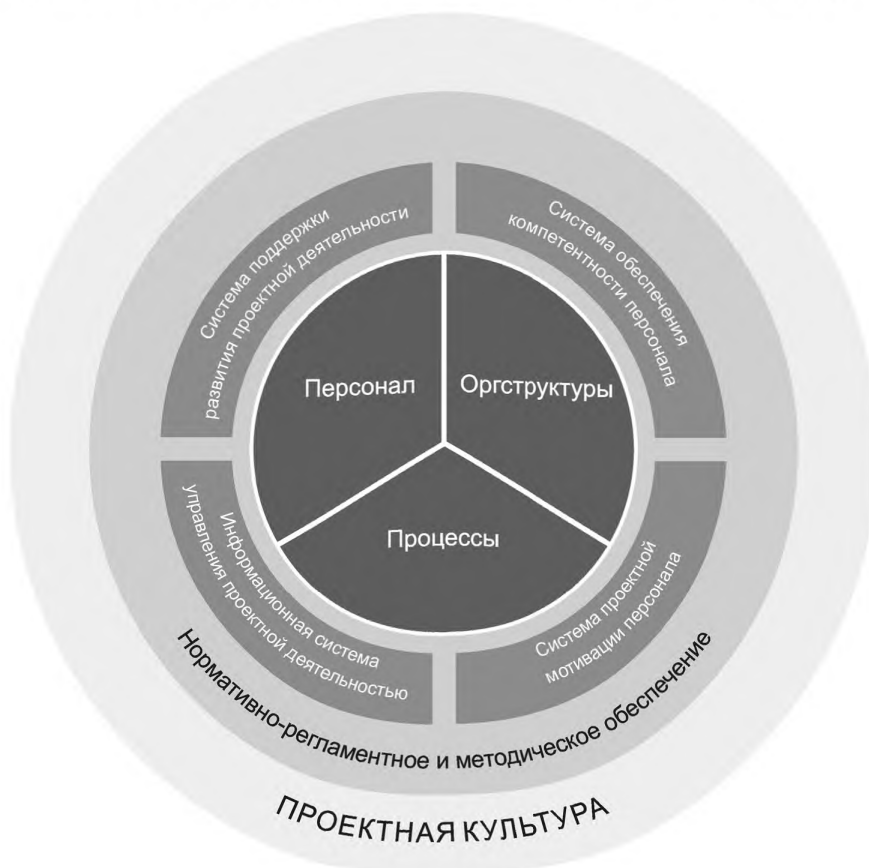
Рисунок 2 — Элементы системы менеджмента проектной деятельности в организации

Все элементы СМГД должны быть задокументированы и поддерживаться нормативно-регламентным и методическим обеспечением (требования к документированию описаны в 6.10).