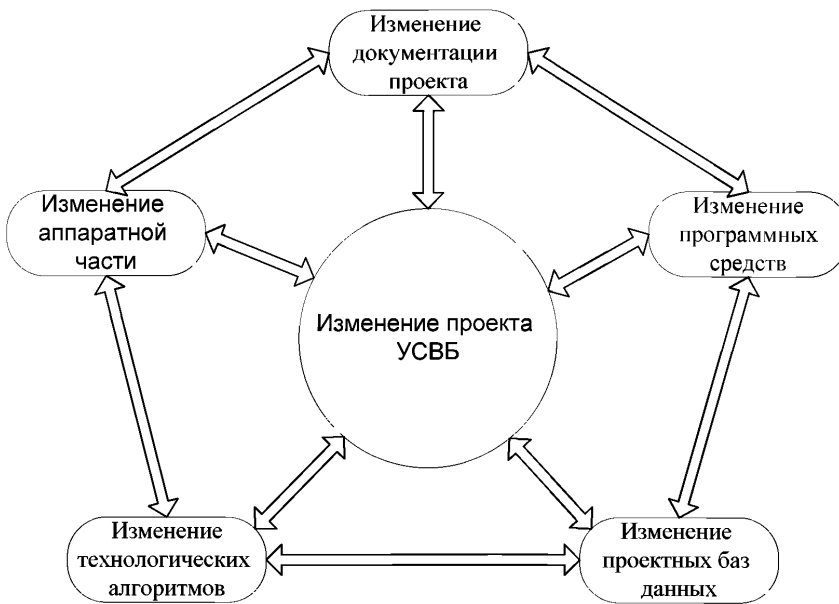
Рисунок 1 – Виды изменений проекта УСВБ