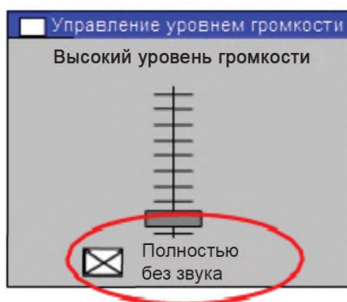
Рисунок 2 — Управление уровнем громкости

Звук должен быть установлен на минимальный уровень громкости (допустимо полное отключение звука, как показано на рисунке 2);