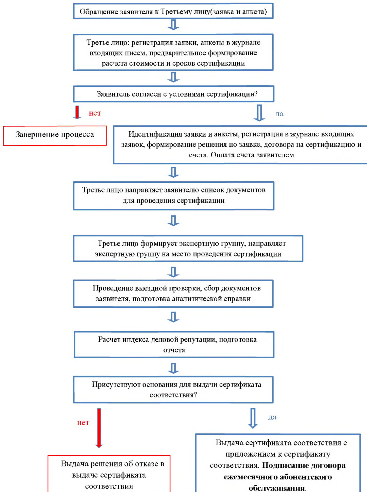
Схема сертификации №1.