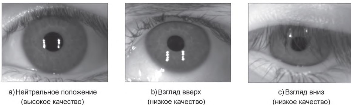
Рисунок 3 — Примеры изображений РОГ с высокими и низкими значениями метрики качества подъема взгляда