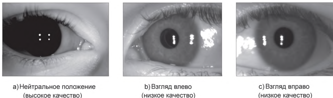
Рисунок 4 — Примеры изображений РОГ с высоким и низким значениями метрики качества азимута взгляда