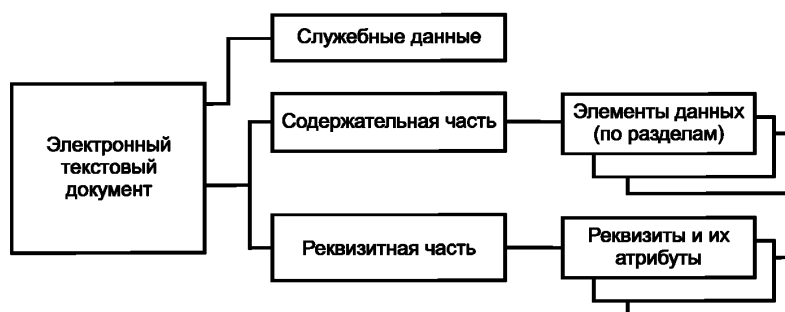
Рисунок 2 — Обобщенная структура электронного текстового документа (верхний уровень)

5.1.6 Обобщенная структура ТД приведена на рисунке 2. Все элементы структуры ТД верхнего уровня обязательны.