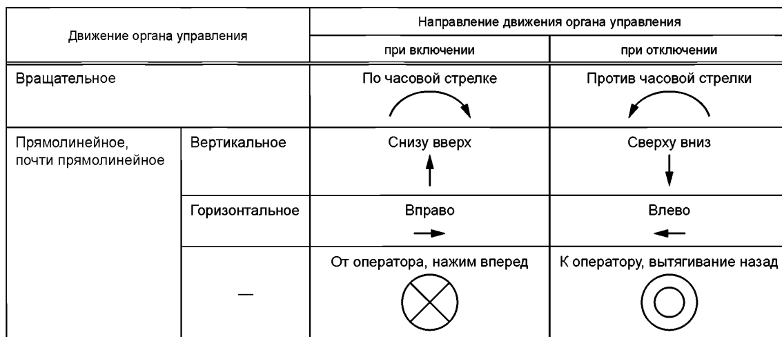
Т а б л и ц а 6 — Характер и направление движения органов управления приводов

5.8.2.3 Приводы разъединителей должны быть снабжены видимыми и не стираемыми в эксплуатации указателями положения. Включенное положение должно быть промаркировано символом «I», а отключенное — символом «0».