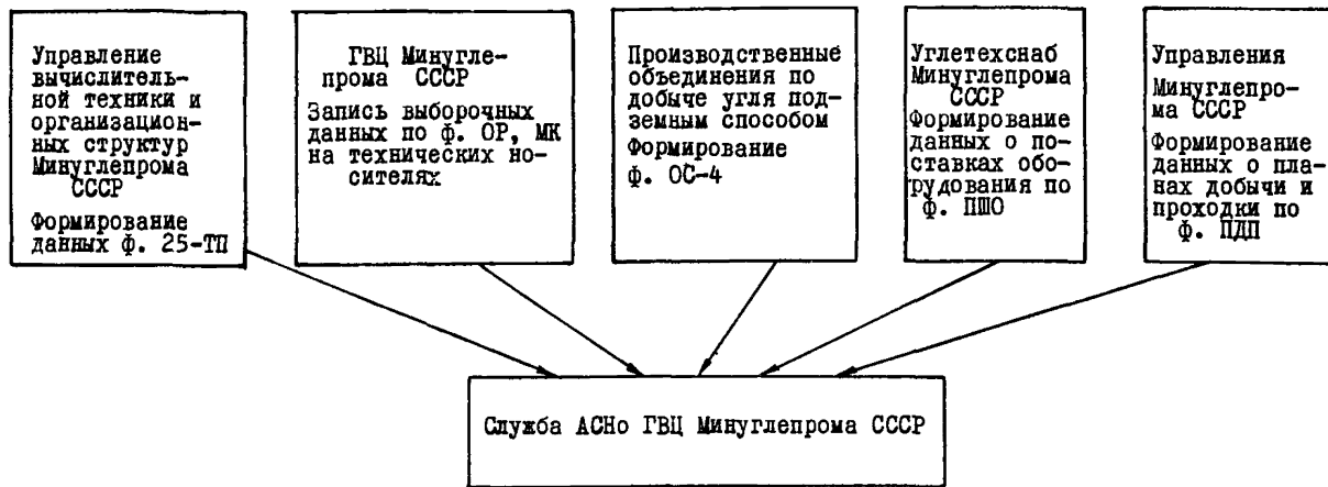
Рис. 2.1. Организационная схема подготовки и передачи данных для использования в АСНО (на уровне Минуглепрома СССР)