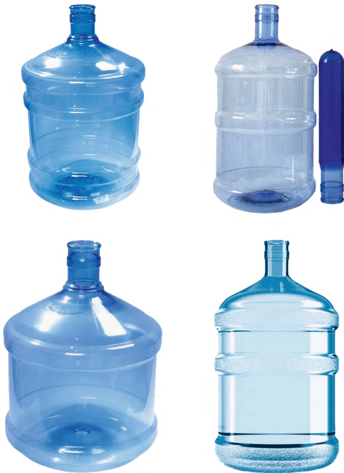
Рисунок А.2 — Бутыли без ручек