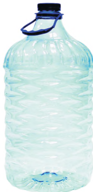
б – бутылка со съёмной ручкой