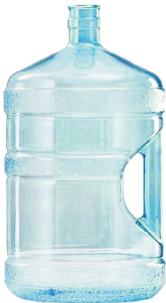
а – бутылка с полкой ручкой