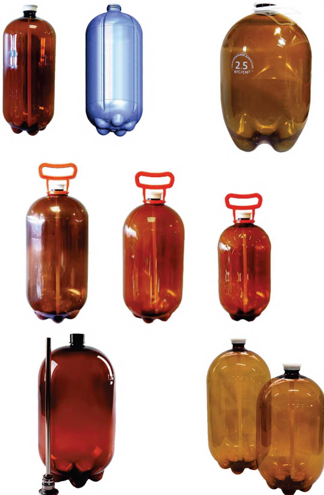
Рисунок А. 3 — Кеги (бутыли)