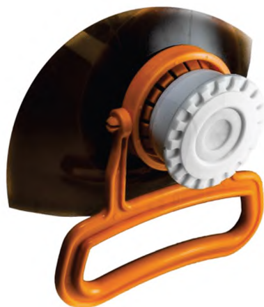
Рисунок А.4 — Съемные ручки для кег (бутылей)