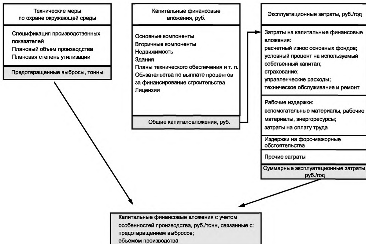
Рисунок 2 — Структура затрат на охрану окружающей среды

Структура затрат приведена на рисунке 2. Доходы, сэкономленные средства и другие поступления включаются в рассмотрение, но указывают в документах отдельной строкой. Перед принятием окончательного решения указанные доходы сопоставляют с конкретными затратами на предотвращение экологического ущерба, дополнительными затратами на производство продукции для определения чистой суммы издержек, ассоциируемой с конкретными мерами по охране окружающей среды.