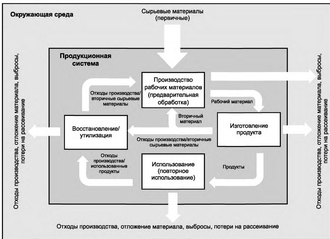
Рисунок 3 — Расход ресурса и движение материалов в течение жизненного цикла

Основываясь на целостном рассмотрении указанных функций и с точки зрения дальнейшей перспективы развития данных систем, следует определить подсистемы, необходимые для оценки эффективности использования ресурсов.