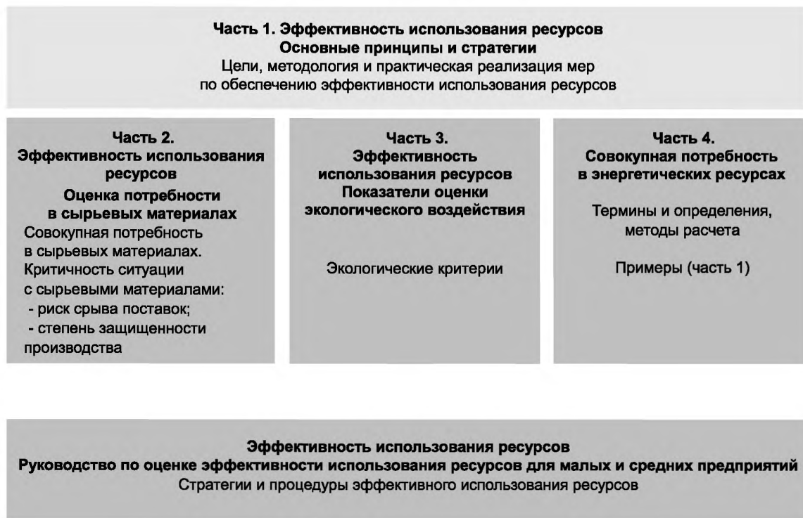
Рисунок 1 — Структура комплекса стандартов по обеспечению эффективности использования ресурсов

Публичное разглашение сравнительных утверждений об эффективности использования ресурсов проводится с учетом установленных правил (например, правил формулирования сравнительных утверждений, касающихся воздействий на окружающую среду и т. п.), разработанных в соответствии с ГОСТ Р ИСО 14044. Данные правила в настоящем стандарте не рассматриваются.