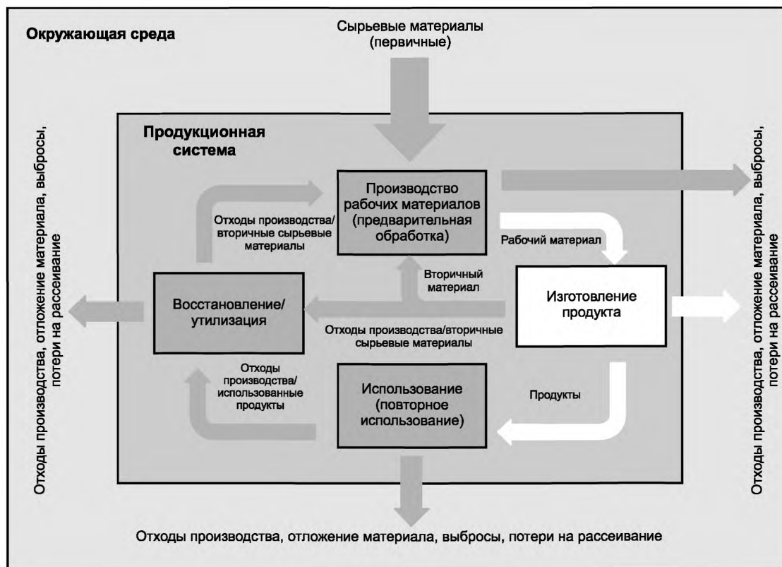
Рисунок 4 — Рассмотрение использования ресурса в области, ограниченной «от двери до двери». Примеры движения материалов при изготовлении продукта

Тем не менее, если происходят встречные эффекты, например уменьшаются затраты материала, а расход энергии растет или если заменяются материалы и уменьшилась экономическая выгода от производства продуктов и предоставления услуг, то возможны изменения в расходе ресурса за пределами границ «от двери до двери». Тогда необходимо расширить область рассмотрения системы за пределы установленных границ. Только тогда можно найти потенциал повышения эффективности использования ресурсов в рассматриваемом производственном цикле создания добавленной стоимости (а также в вышестоящих и нижестоящих производственных процессах).