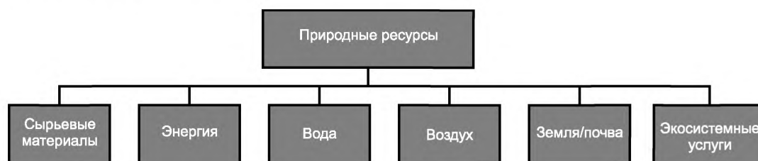
Рисунок 2 — Категории природных ресурсов

Вода и воздух также относятся к сырьевым материалам. Но они исключаются из списка исходных сырьевых материалов вследствие их особой важности. Каждый из этих ресурсов формирует свою отдельную категорию ресурсов.