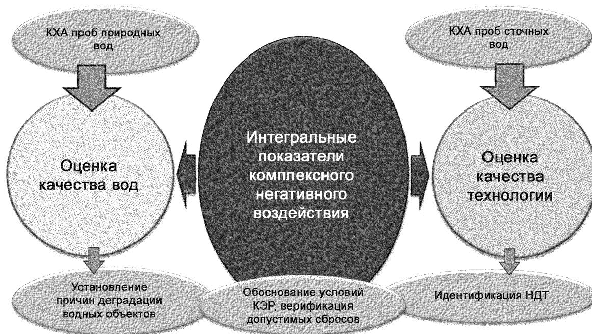
Рисунок Г.1 — Унификация экологического научно-аналитического сопровождения технологического регулирования водопользования