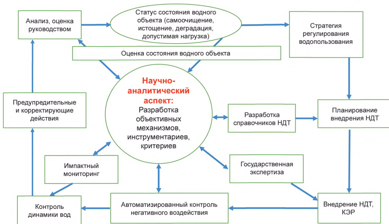
Рисунок Д.1 — Петля качества государственной функции регулирования водопользования

Петля качества регулятивной функции включает обязательную процедуру — научно-аналитическое сопровождение регулирования водопользования, акцентирование которого объясняется следующими основными причинами: