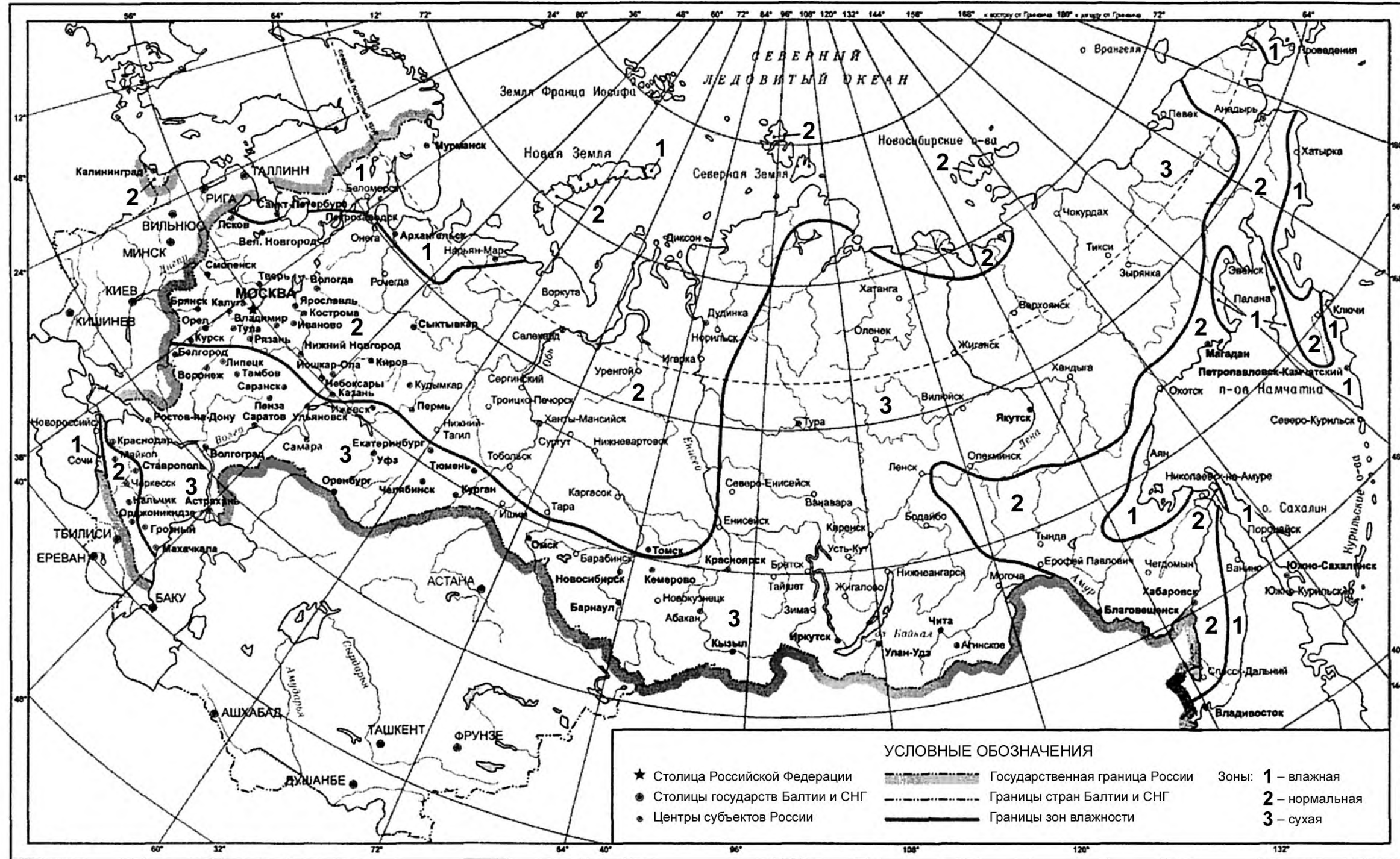
Карта Российской Федерации с зонами по влажности