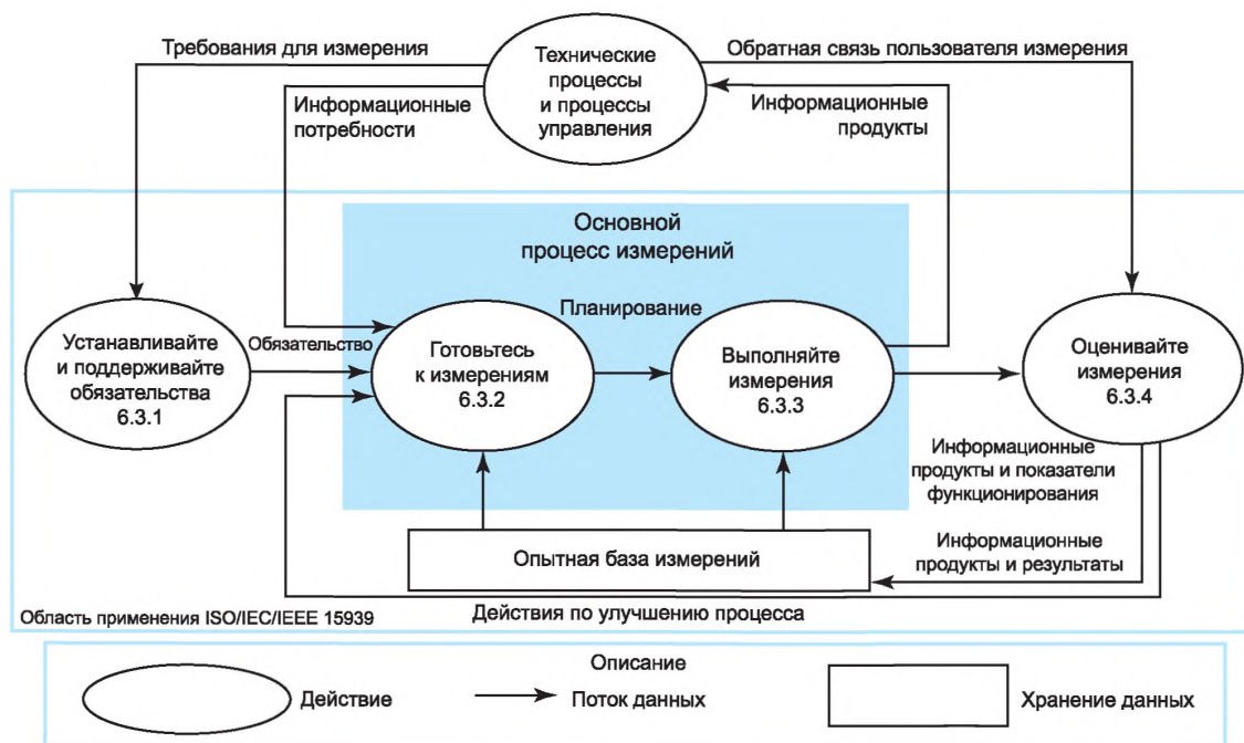
Рисунок 1 — Модель процесса измерения

«Технические процессы и процессы управления» организационной единицы или проекта не входят в область применения настоящего стандарта, хотя они являются важными внешними воздействиями для действий измерений, которые включены в настоящий стандарт.