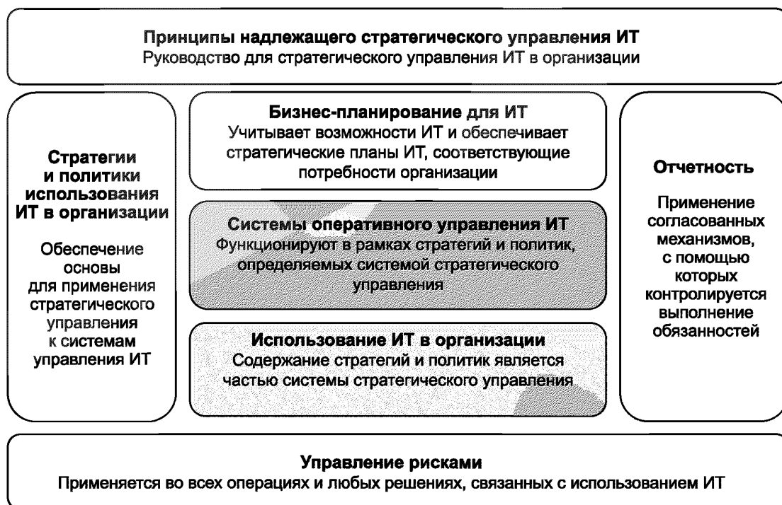
Рисунок 2 — Основные элементы системы стратегического управления ИТ

Фактическая система стратегического управления будет определяться самой организацией и зависит от ее размера и функций, а также решений руководящего органа относительно зоны ответственности, но основные элементы должны соответствовать рисунку 2. Заштрихованная область соответствует элементам управления.