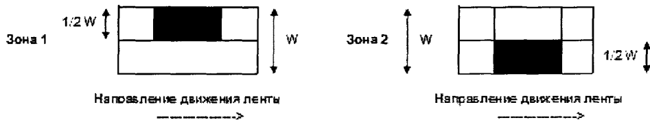
Рисунок 1 — Расположение испытательных нагрузок для СИ, осуществляющих взвешивание динамически