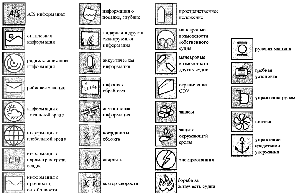
Рис. Б-3 Пояснение используемых на рис. Б-1 и Б-2 пиктограмм

2.4 Проверка проводится или в ходе натурных испытаний (например ходовых испытаний), или с применением номерной версии ПО системы управления МАНС, или на номерной версии ПО виртуальной платформы моделирования навигационной обстановки, при взаимодействии которых: