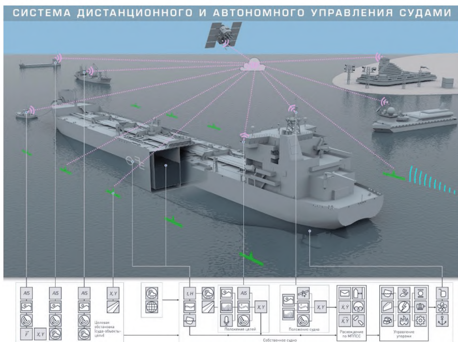
Рис. Б-1 Проверяемое судовое оборудование