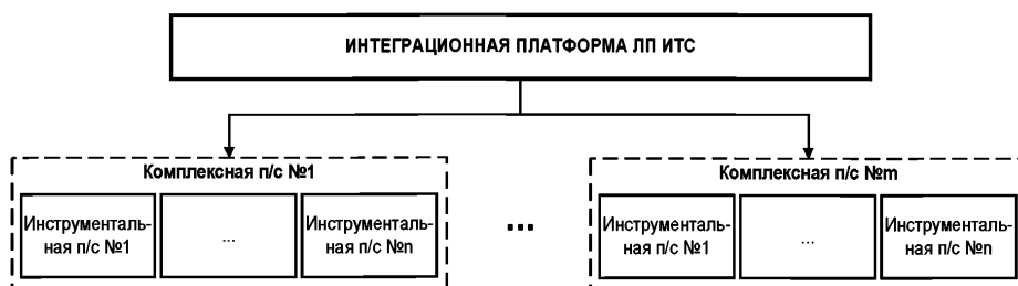
Рисунок 1 - Физическая типовая архитектура ведомственной ИТС

8.11 Структура подсистем ведомственной ИТС должна быть выстроена по иерархическому принципу в соответствии с физической архитектурой ИТС (рисунок 1).